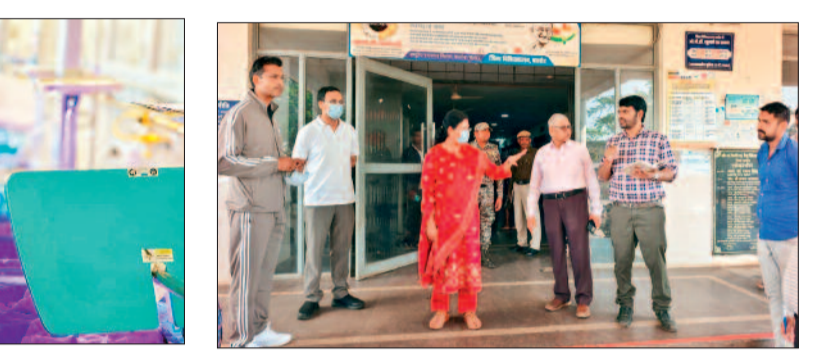
कलेक्टर दिव्या उमेश मिश्रा सुबह जिला चिकित्सालय बालोद का आकस्मिक निरीक्षण कर व्यवस्थाओं का जायजा लिया।

कलेक्टर दिव्या उमेश मिश्रा सुबह जिला चिकित्सालय बालोद का आकस्मिक निरीक्षण कर व्यवस्थाओं का जायजा लिया। निरीक्षण के दौरान चिकित्सकों एवं कर्मचारियों के समय पर उपस्थित नही होने पर कलेक्टर ने गहरी नाराजगी व्यक्त करते हुए मुख्य अस्पताल अधीक्षक को इनके विरुद्ध कारण बताओ नोटिस जारी करने के निर्देश भी दिए। निरीक्षण के दौरान कलेक्टर मिश्रा ने मरीजों एवं परिजनों से बातचीत कर उनके स्वास्थ्य की स्थिति एवं अस्पताल में उन्हें मिल रहे सुविधाओं के संबंध में जानकारी ली। इस