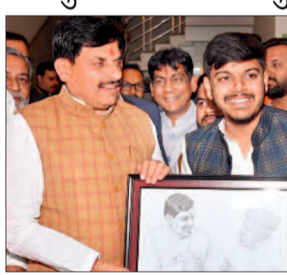
हरिभूमि न्यूज ►► बालोद

भाजपा नेता व जिला मिडिया प्रभारी अभिन्न यादव ने रायपुर में स्वागत किया। इस दौरान उन्होंने मुख्यमंत्री मोहन यादव से सौजन्य भेंट की तथा उनको हस्त निर्मित उनका फोटो भेंट कर स्वागत किया। इस दौरान बड़ी संख्या में भाजपा नेताओं के साथ युवा नेता डॉ मोहन यादव के स्वागत के लिए पहुंचे थे। राज्य के दौर पर रायपुर पहुंचे मध्यप्रदेश के मुख्यमंत्री मोहन यादव का युवा