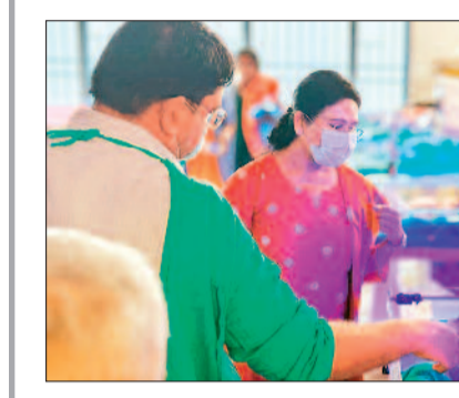
हरिभूमि न्यूज ►► बालोद

कलेक्टर दिव्या उमेश मिश्रा सुबह जिला चिकित्सालय बालोद का आकस्मिक निरीक्षण कर व्यवस्थाओं का जायजा लिया। निरीक्षण के दौरान चिकित्सकों एवं कर्मचारियों के समय पर उपस्थित नही होने पर कलेक्टर ने गहरी नाराजगी व्यक्त करते हुए मुख्य अस्पताल अधीक्षक को इनके विरुद्ध कारण बताओ नोटिस जारी करने के निर्देश भी दिए। निरीक्षण के दौरान कलेक्टर मिश्रा ने मरीजों एवं परिजनों से बातचीत कर उनके स्वास्थ्य की स्थिति एवं अस्पताल में उन्हें मिल रहे सुविधाओं के संबंध में जानकारी ली। इस